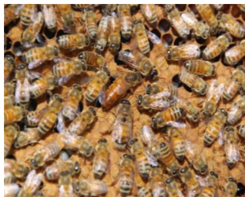
元気なミツバチたち