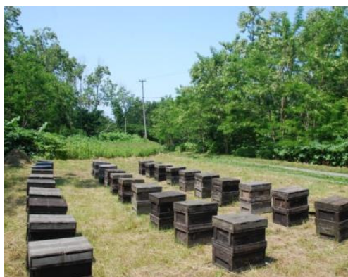
野山に置かれた巣箱