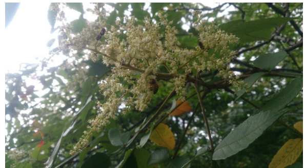
ミツバチが訪花している様子(ヌルデの花/9月)