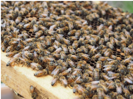
活気あふれるミツバチ