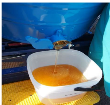
収穫したはちみつ(写真は5月上旬)