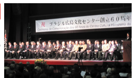
ブラジル広島県人会創立60周年記念式典の様子

ブラジル、ペルー、パラグアイ及びアルゼンチンを訪問し、各広島県人会の創立周年記念式典などに出席しました。また、メキシコ合衆国グアナフアト州も訪問し、本県との友好提携1周年の記念式典等に出席しました。 【日程】平成27年10月20日(火)～31日(土) 【主要行事】・各国広島県人会創立周年記念式典、慰霊碑参拝など ・グアナフアト州議会訪問、友好提携1周年記念式典・食文化交流会など