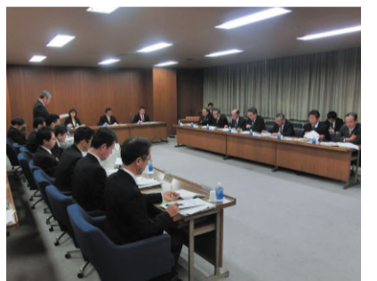
農林水産委員会における集中審議の様子

平成24年10月に制定した「広島県行政に係る基本的な計画の策定等を議会の議決事件等として定める条例」に基づき、県行政の各分野における基本的な計画(分野別計画)を策定または変更する場合は、執行部と議論を深め、議会の意見を反映することとしています。 具体的には、策定または変更する計画について、所管委員会が骨子案の段階から執行部の説明を受け、集中的に審議を行い、議会としての意見・提言を議長から知事へ提出し、知事は、それらを踏まえて計画を策定または変更します。 なお、今年度対象の分野別計画には、「広島県まち・ひと・しごと創生総合戦略」、「行政経営の方針」、「中期財政運営方針」、「広島県環境基本計画」、「社会資本未来プラン」などがあります。