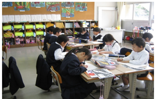
1年生「いろいろなふね」調べ学習の様子 「のりものカード」にまとめ、発表し合いました。