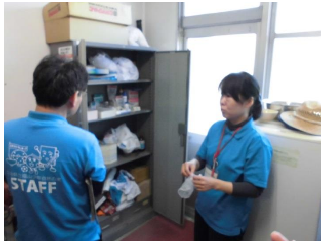
ケガなどへの応急処置の仕方の講習