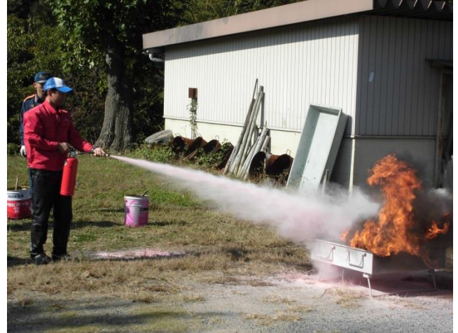
消火器による初期消火訓練の様子