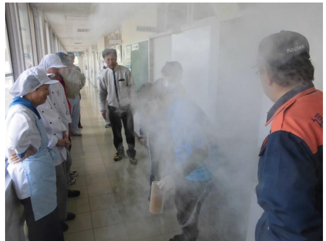
模擬煙による避難誘導訓練の様子