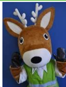
「減らそう犯罪」県民総ぐるみ運動 マスコットキャラクター「モシカ」