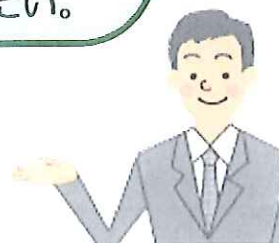
雇用管理 アドバイザー

当センターの委嘱を受けた介護分野の雇用管理・人材育成・助成金・健康管理に詳しい専門家(社会保険労務士、中小企業診断士、行政書士、産業カウンセラーなど)です。