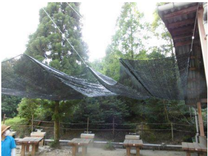
炊さん場の設置の様子