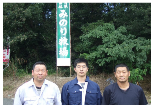
みのり牧場(下津田農場)