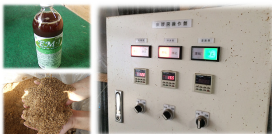
EM菌で作ったボカシ及び県内唯一の床暖房設備