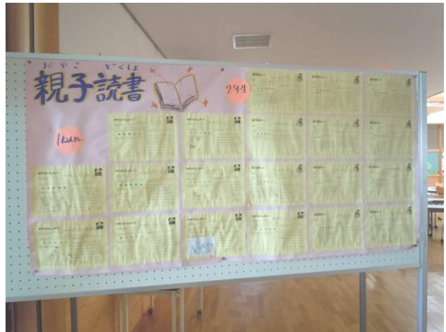
親子読書カードの掲示