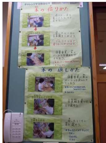
本の貸出方法について