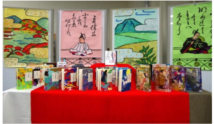
【古典コーナー】～古典の日に合わせて～