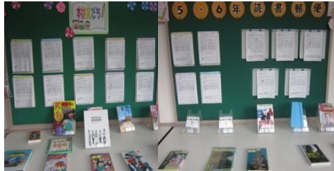
校舎内の本コーナー(高学年)