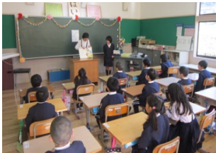
図書委員による読み聞かせ (入門期の児童へ)