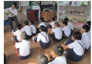
教職員による読み聞かせ