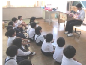
中学生による読み聞かせ