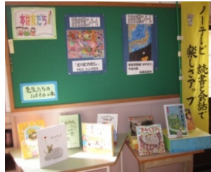
先生のおすすめコーナー