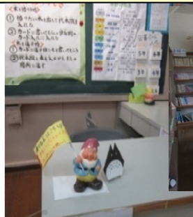
みこと図書館1(読書センター)