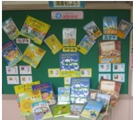
課題図書の紹介コーナー