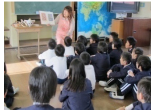
地域ボランティア 「ダンボの会」による読み聞かせ