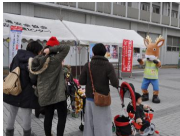
会場内での防犯広報用ブースでは、来場したちびっこたちを「モシカ」がお出迎え。