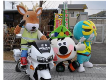
交通安全マスコットキャラクター「キラリ☆マン」や「ヒコア」も一緒に会場を盛り上げました。