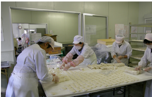
【女性部を中心とした加工品の製造】 (餅の真空パック作業)