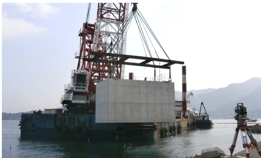
ケーソン据付状況（11月6日）

平成25年9月17日から現地着工し、11月末までに、基礎捨石、本体ブロック設置を完了し、埋立1工区の外郭が姿を見せています。 12月からは、取付部等の現場打コンクリート工を施工します。