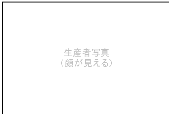
生産者写真 (顔が見える)