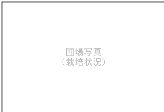
圃場写真 (栽培状況)