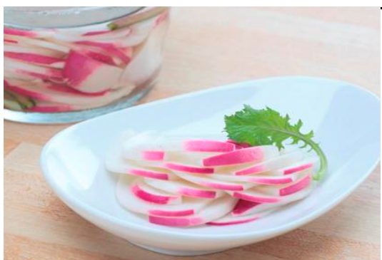
彩り綺麗な「甘酢漬け」