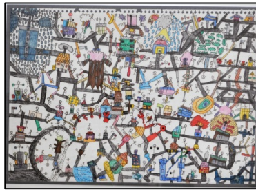
⑤銀賞 若佐 真弓 「地図」