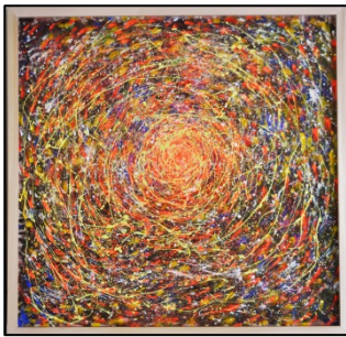
④金賞 あんずの家 「ぐるるっ！」