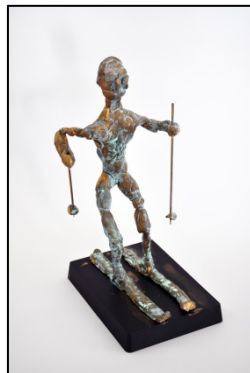
⑪特別賞 峰 航一朗 「クロスカントリーを楽しんでいる自分」