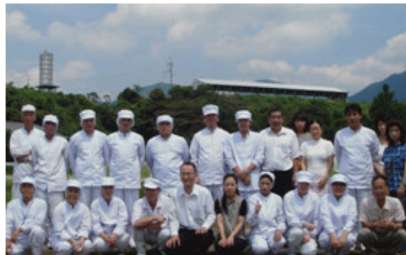
地元の人を作っています