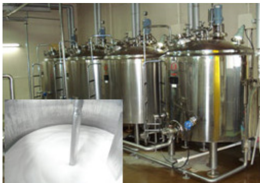
パス釜でじっくりと丁寧に煮込みます