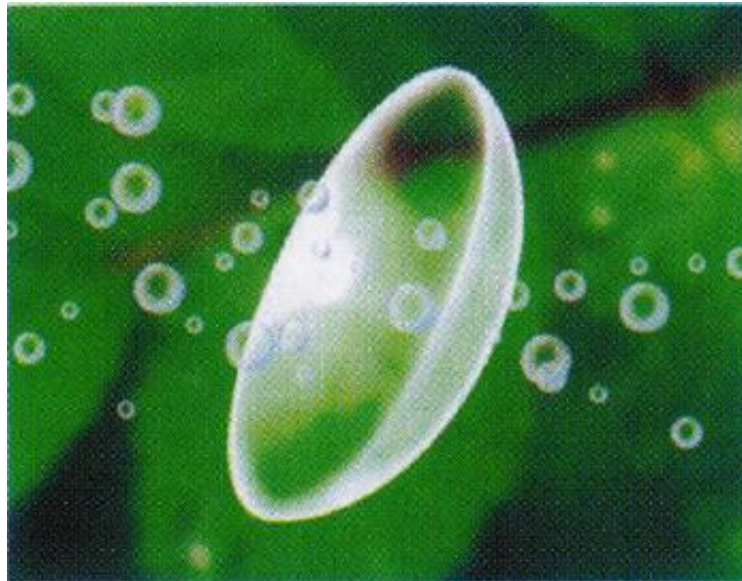
酸素透過ハードコンタクトレンズ (イメージ)