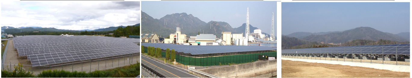
福富第1太陽光発電所