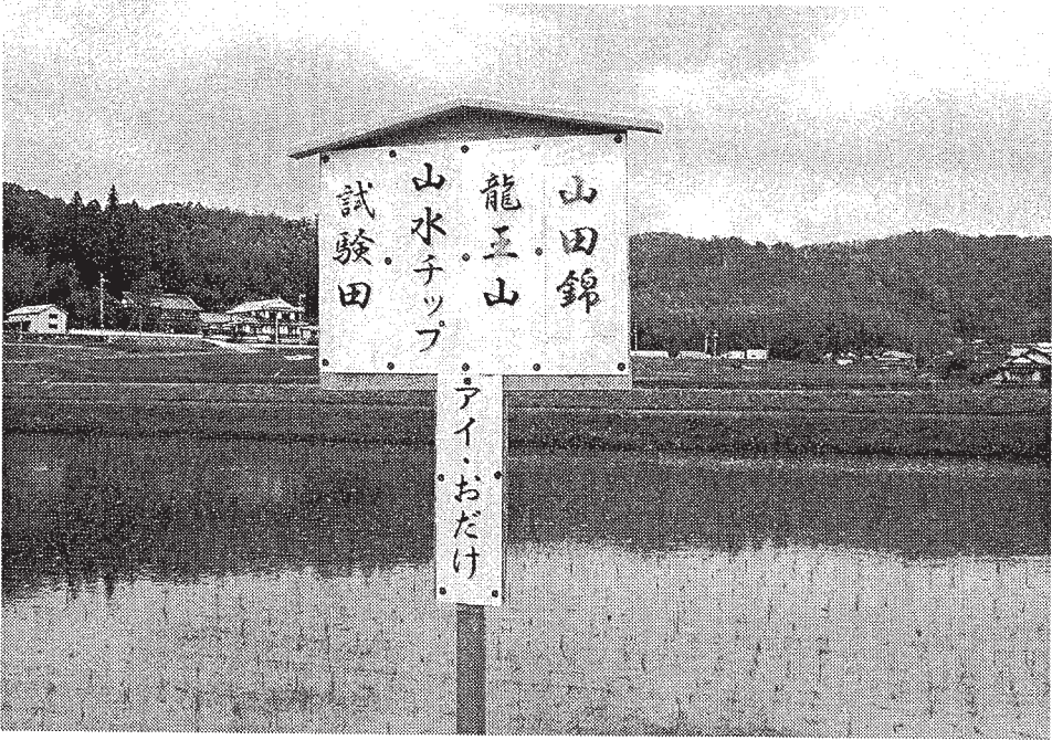
酒米 山田錦 造賀高原 山田錦の里