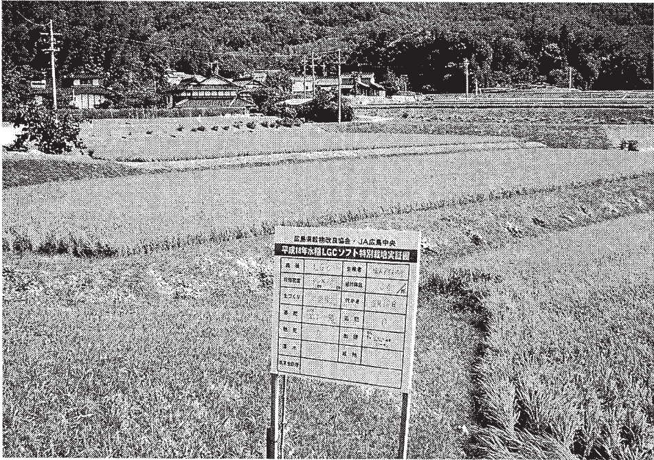
健康米 LGCソフト「安心！広島ブランド」登録