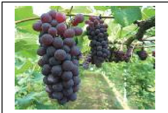
デラウエア(ぶどう)