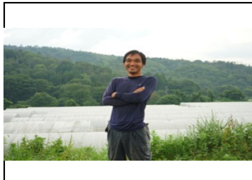
ミニトマト生産者