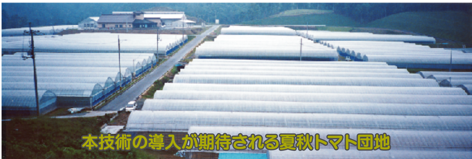
本技術の導入が期待される夏秋トマト団地

表の値は図の1枠に当てはまり、適正値を示しています。測定値が1枠内の場合、施肥は通常どおり行います。また、2枠の範囲内の場合は施肥量を通常よりも控えます。逆に3枠内の場合は施肥量を増やします。