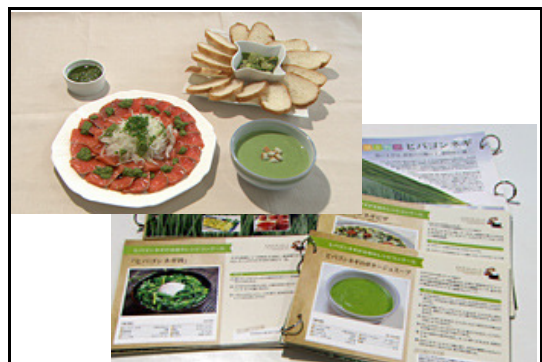
地元料理グループとネギ料理のレシピ開発