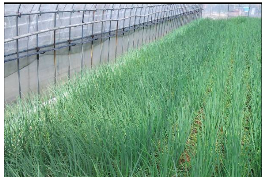
ハウス内のネギの様子