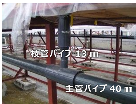
図 4 各栽培槽へパイプを連結