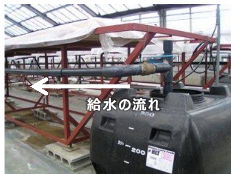
図 5 タンクから給水