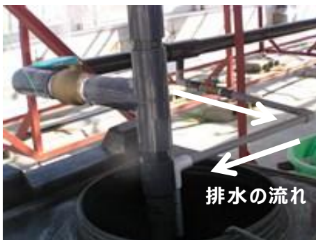
図 6 タンクへ戻る