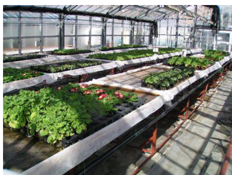
図 1 自作した底面給水装置