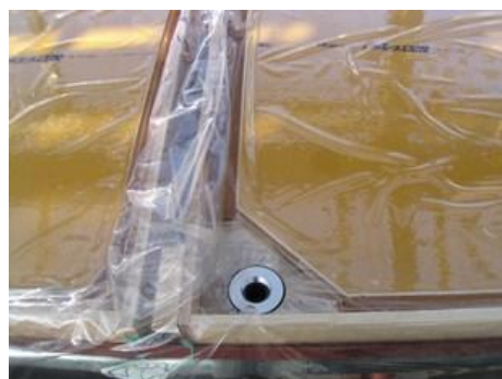
図 3 給排水金具とビニール敷き