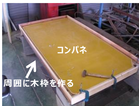
図 2 栽培槽の作製