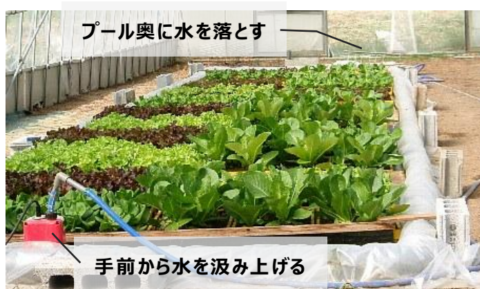
図 2 浮き楽栽培法によるリーフレタス栽培のプール水循環方法