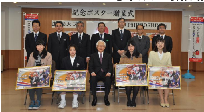
受賞者のみなさんと記念撮影しました