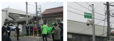
八本松駅前防犯カメラ落成式