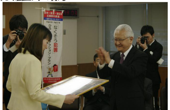
P3ポスター贈呈式の様子