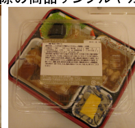
メディカルフードサービス(株)