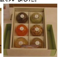
(株)アオイコーポレーション