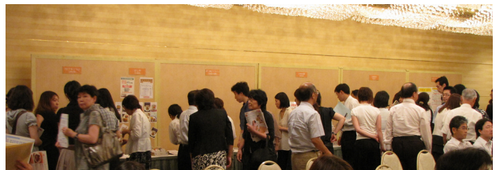
実際の商品サンプルやカタログの展示紹介に、大変賑わいました。