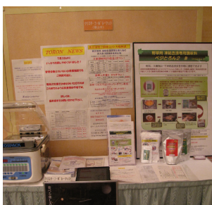
(有)キッコーホールディング