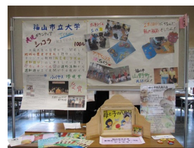
昨年のブースの一例

なお、当日は準備の時間が限られているので、事前に作成されておいた方がよいと思います。また、作成された掲示物は、交流会終了後に、センターホームページに掲載します。