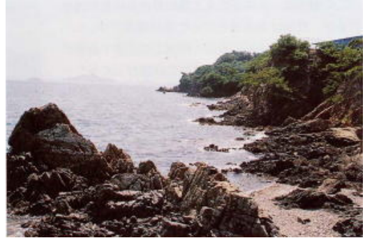
海食崖や岩礁帯と砂礫浜が連なった海岸

海岸に接した陸域は、森林と宅地です。指定区域は、海岸線に接した帯状の森林で、クロマツ、ウバメガシなどが生立し、海食崖と一体となって優れた景観を見せています。