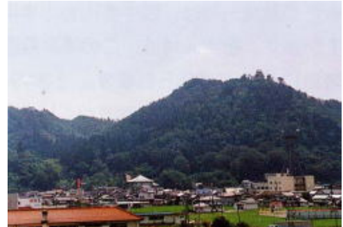
北側から望む全景

今高野山は、新しい高野山という意味で、中国地方有数の真言密教の霊場として栄え、今でも多くの参詣者があり、甲山町の象徴となっています。