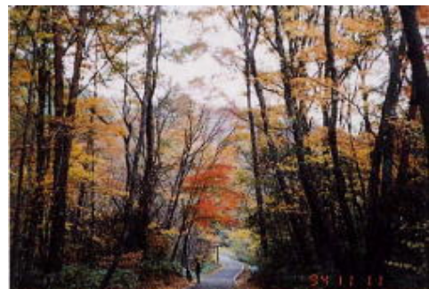
紅葉の美しい遊歩道