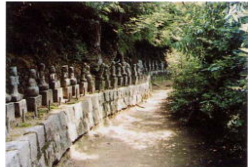
郡山大師堂横の地蔵