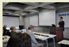
開催会場の様子(受講風景)