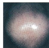
進行の程度には個人差があります。