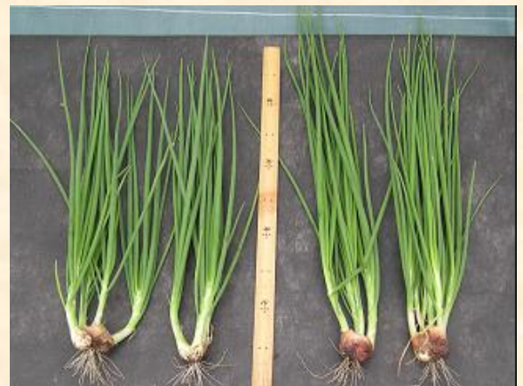
手植え 新植え付け法

◆圃場での植え付け時間は10%に、つらい中腰手作業はゼロに削減 種球詰めは、種球調製作業時に行い効率化