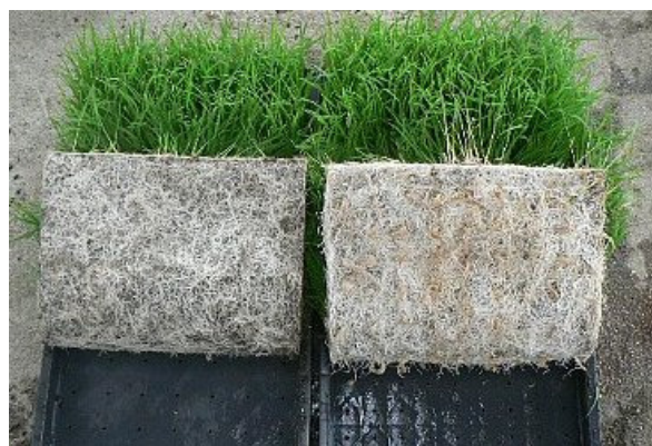
図4 頭上かん水(左)と半浸水フロート式栽培法(右)による水稻苗のルートマット

b) 長町のつらさ指数。1~3:座った姿勢~目より高い物を取る作業 4~5:軽く膝を曲げて立つ~膝を伸ばして上体を45~90度前屈する作業 6~10:膝を曲げた中腰姿勢~膝を深く曲げて上体を90度以上前屈する作業