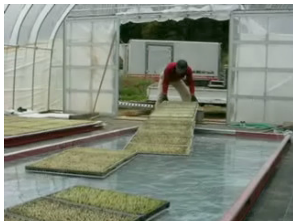
図2 ローラーコンベアを利用した半浸水フロート式栽培法の育苗箱搬入作業

フロート区の育苗箱搬入作業は、前述の集落法人で行った、ローラーコンベア(幅30cm×ローラーピッチ10cm×長さ300cm)をハウス入り口からプール内へ3度の傾斜で設置し、育苗箱を載せたフロートをプール内にすべり入れる方法で行った(図2)。フロートの整列は、水に浮かんだフロートを棒で操作して行った(図3)。これらの方法による育苗箱9箱分の作業をビデオカメラで撮影し、1秒間隔で作業姿勢を分析して、