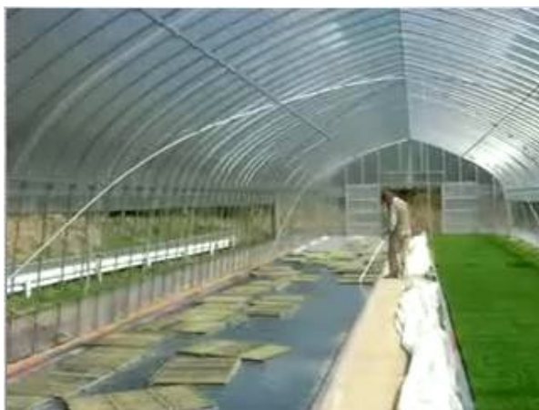
図3 半浸水フロート式栽培法における育苗箱整列作業