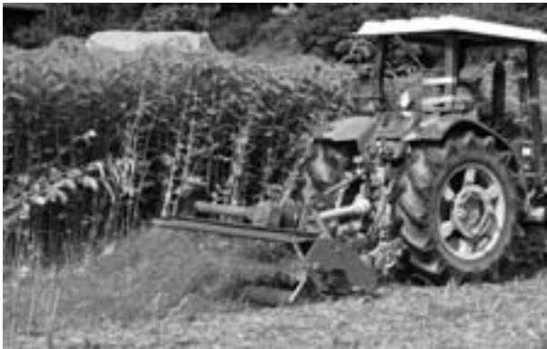
図3 フレールモアによるセスバニアの細断