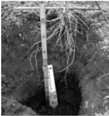
図1 セスバニアの根の状況