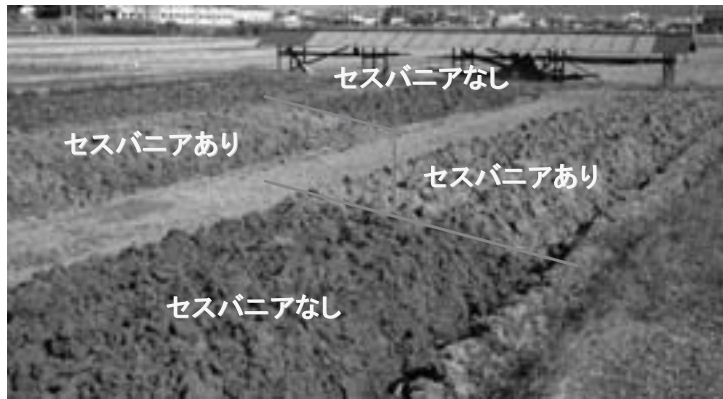
図2 セスバニアすき込み跡地の土壌の状況