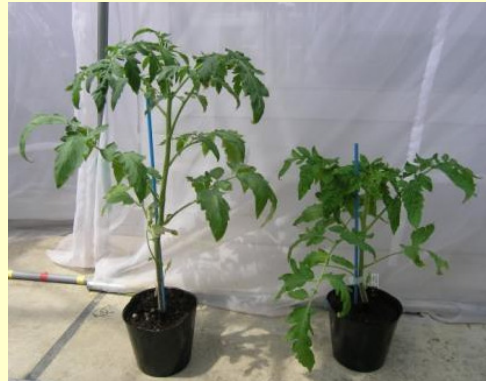
図-1 トマト退緑萎縮ウィロイド(TCDVd)に感染したトマト(右)と健全トマト(左)