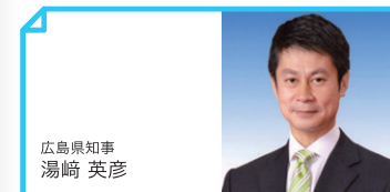
広島県知事 湯崎 英彦

広島県では、女性が結婚や出産後も働き続けたいことのできる環境づくりや、再就職を希望される女性への細やかな相談体制など、「女性が働きやすい職場づくり」に重点的に取り組んできました。今働いている方、もう一度働きたい方、働くことに対する女性の悩みは様々にあると思います。このハンドブックがそんな女性の悩みに寄り添い、解消の一助となれば幸いです。これからも、広島県では女性の皆さんの活躍を全力でサポートしてまいります。