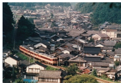
備後西城〜平子間にて 58系気動車 昭和 62.8.9 55系に代わる優等列車用気動車として、昭和36年に登場。急行形として親しまれてきた。芸備線では白地に緑色のイメージも強い。