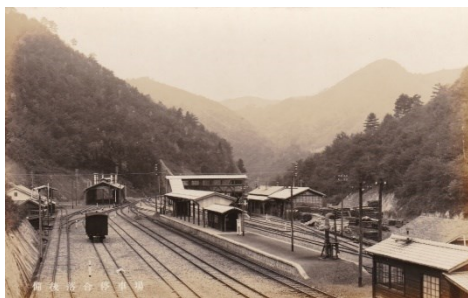
備後落合停車場(昭和12年12月 木次線全通記念絵葉書より) 昭和12年12月12日に木次線が開通した際の記念絵葉書の写真。跨線橋が見えるが、戦時中の金属供出で撤去されたと言われており、今は無い。