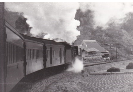
備後八幡〜小奴可間にて 新見発広島行 昭和43.12.28