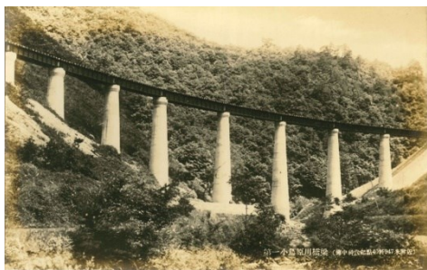
完成したばかりの第一小鳥原川橋梁(昭和11年10月10日 三新線全通記念絵葉書より)

三次と備中神代の双方から伸びた線路は、昭和11年10月10日、小奴可〜備後落合間の開通によって繋がりました。三神線に編入、広島〜備中神代間159kmに及ぶ現在の芸備線の路線が全通しました。