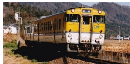
井原市〜志和口間にて 40系気動車 平成 13.12.23 20系気動車の後継車として昭和52年に登場。現在も広島〜三次間の主力車両として活躍している。