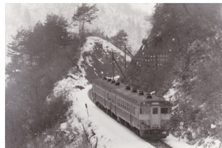
備後落合〜道後山間にて 45系気動車 昭和 43.1.3