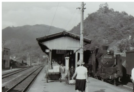
備後落合にて C58形(C58 345) 昭和42.8.12 新見発広島行 昭和10年12月20日に開業した備後落合駅は、芸備線と木次線の接続駅であり、優等列車の機関車付替え作業などを行うため、駐泊所を有するターミナル駅であった。かつては道後山登山や三井野原スキー場などへ行く乗客たちが繁盛していたが、現在は、全国で最も利用客数の少ない過疎路線区間の秘境駅となっている。