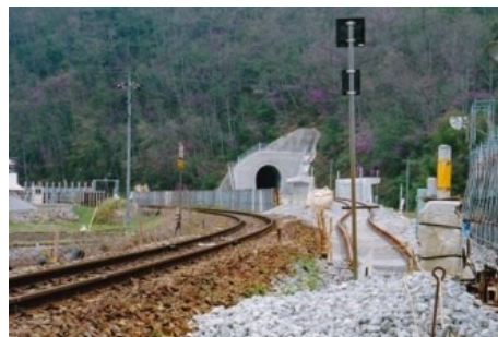
郷原トンネルは、平成18年4月に甲立〜上川立間に新設された芸備線で最長のトンネル(798m)。県道を拡幅するため、県道に並行していた芸備線の線路敷を拡幅用地とし、山側にトンネルを掘削して線路を移設した。