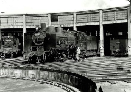
三次機関区 扇形庫