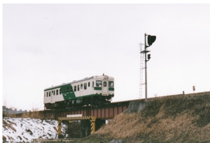
下和知〜塩町間にて 52形(キハ52140) 三次発備後落合行 平成 8.2.12 52形は大系線で使われていたもの。平成7年7月の集中豪雨により、南小谷〜小滝間が寸断され長期運休となった際、余剰車両が芸備線の三次以東に一時期だけ投入された。

気動車については、当初55系（旧準急形）や20系（一般形）が主力でしたが、昭和40年代から急行用58系が数多く運行するようになり、50年代には普通車両の主力として40系が登場、55系や20系は姿を消しました。