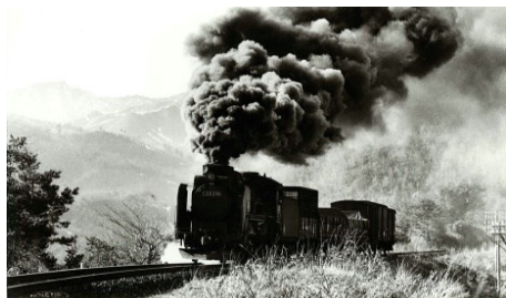
備後落合〜道後山間にて 昭和43.3.23