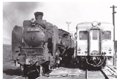
芸備線管理所にて 昭和 43.3.23 C58形機関車(C58146)と並ぶ 20系(キハ20456)気動車