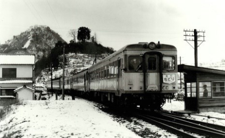
備後西城駅に入る急行「第1ちどり」(55系気動車) 昭和43.1.3