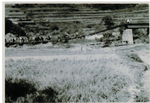
昭和20年10月中旬 平成30年7月豪雨で流失した第一三篠川橋梁は、昭和20年9月17日の枕崎台風の際にも流失していた。これはその当時の様子を写した貴重な写真。橋脚が流失した個所には、新たにコンクリートの橋脚が設置され、鉄橋は再建されていたが、平成30年7月豪雨では、枕崎台風の際に流失を免れていた橋脚が倒れ、落橋した。