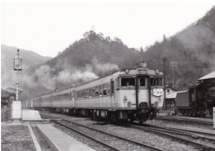
備後落合駅を発車する 急行「いなば」 昭和43.3.24