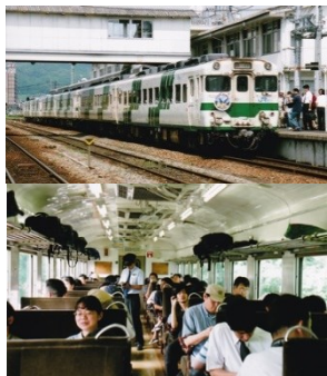
三次駅に停車する最終日の急行「みよし2号」と車内の様子 平成 19.6.30

平成14年3月、長年親しまれた急行「ちどり」「たいしゃく」が廃止。58系気動車の定期急行として全国で唯一残っていた急行「みよし」も、平成19年7月1日をもって廃止されました。