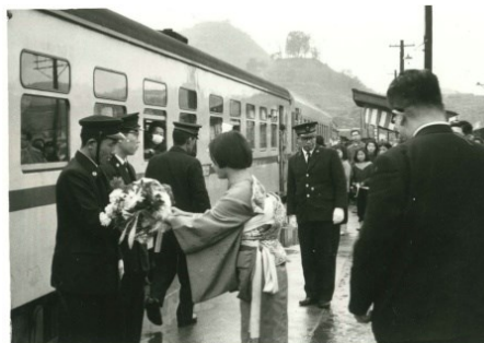
備後西城にて初日の準急「しらぎり」 広島発米子行。 昭和37.3.15