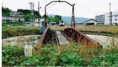
三次駅 旧三次機関区転車台 平成 19.6.5 三次機関区の転車台は平成28年4月まで残っていたが、SLの復活運転を計画していた東武鉄道へ譲渡され、現在は東武鬼怒川線の鬼怒川温泉駅前に設置され、新たに蒸気機関車の転車台として現役復活している。