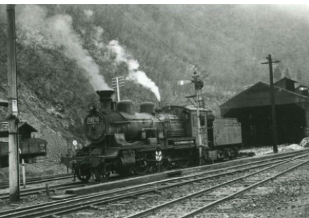
備後落合駅にあった蒸気機関車の駐泊所 昭和42.8.12 ひなびた山間の狭い機関区で、常に複数の蒸気機関車が待機していた。