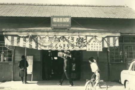
備後西城にて初日の準急「しらぎり」 昭和37.3.15