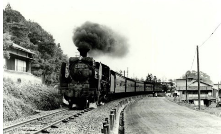
矢賀〜戸坂間にて C58 60 昭和41.11.12 広島発備後落合行