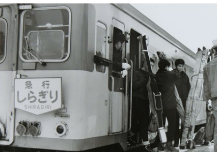
道後山駅にて 急行「しらぎり」 昭和43.1.2