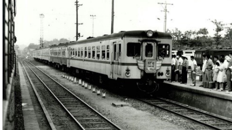
三次駅にて 準急「第1ちどり」 昭和36.8.16

岡山発広島行。岡山〜新見間は、伯備線・山陰本線・鹿兒島本線経由の博多行準急「しんじ」を併結して運行する。