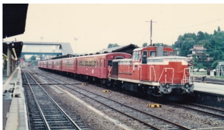
三次駅にて 50系客車(一般形) 昭和 62.8.9 昭和52年に旧型客車の老朽化対策として導入され、「レッドトレイン」の愛称で親しまれた。1両あたりの製造コストが気動車や電車より格段に安かったため、余剰化した電気・ディーゼル機関車を活用することにより、地方での通勤・通学用車両として長編成で使用されていた。

この展示で使用した写真は、とくに断らない限り、全て当館収蔵の長船友則氏収集資料（文書番号 200407）です。これらの写真は、所定の申請手続きにより、複写、出版物への掲載、展示などに御使用いただけます。（担当 西向宏介）