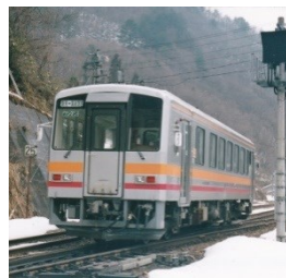
120形気動車 平成 8.3.8