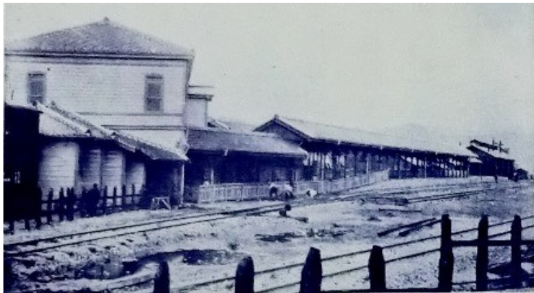
芸備鉄道本社・東広島駅(大正4年『芸備鉄道案内』より)

大正2年12月13日、下深川停車場予定地で起工式が挙行され、同4年4月には東広島(現広島貨物ターミナル)と志和の間が開通、6月1日には三次駅(現西三次)まで延伸開通しました。