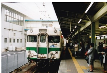
広島駅に到着した最終日の急行ちどり 平成 14.3.22