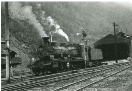
備後落合にて78675 昭和37.3.11 78675は昭和13年に芸備線に配置され、その後昭和45年10月に和歌山機関区へ移転した。昭和47年5月に廃車となったが、奈良県五條市が無償貸与を受け、現在は五條市の史跡公園で静態保存され、現存している。

昭和12年7月1日、芸備鉄道の広島〜備後十日市間が国有化されると、C56形テンダー機関車(炭水車連結)やC12形タンク機関車が配置されました。昭和16〜17年には、C56形の多くが海外へ供出となり、後継機として、県北の急勾配にも対応する8620形が配置され、昭和24年頃までの主力機となりました。また、この頃からC58形の配置が始まり、快速「ちどり」を牽引するなど活躍しました。