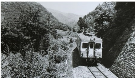
備後落合〜比婆山間にて 準急「たいしゃく」 昭和37.8.18

しかし、昭和47年3月15日に山陽新幹線が岡山まで開通すると、山陰方面への動脈として伯備線が重視されるようになりました。特急「やくも」が新設された反面、芸備線の陰陽連絡急行は木次線経由に一本化されるなど、縮小の方向に転じていきました。