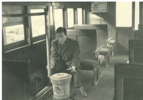
備後落合〜新見間のストーブ列車(オハ31 189)にて 昭和37.3.11