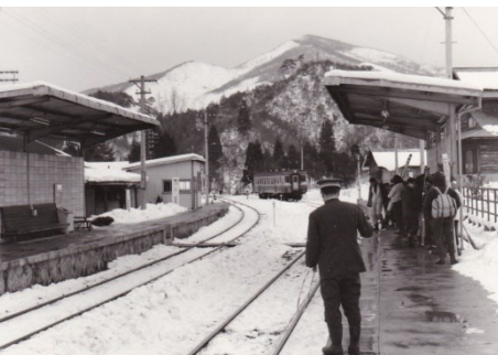
スキー客でにぎわう道後山駅 キハ20 4 昭和43.1.3