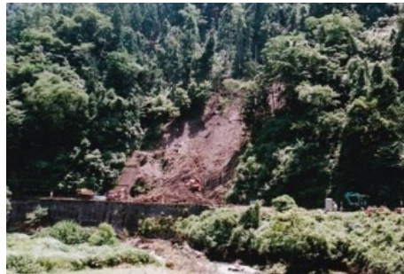
備後落合〜比婆山間 かけ崩れの現場 平成 18.7.26 平成18年7月15日から24日にかけて、九州・山陰・北陸地方を中心に豪雨となり、芸備線と三江線では、かけ崩れの発生で不通となった。芸備線では、7月18日に備後落合〜比婆山間で大規模な斜面崩落が起き、備後落合〜備後西城間が不通となり、20日から備後西城駅での代行バス運転となった。復旧工事が完了したのは翌年4月1日であり、ようやく全線で運転が再開された。