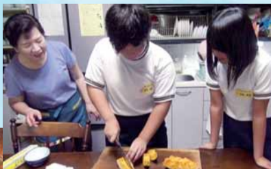
民泊した家で食事づくり