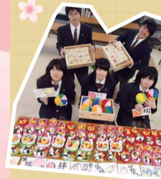
地域の廃材を利用して木工製品を開発。整理箱は行列ができるほど好評。 尾道特別支援学校 しまなみ分校