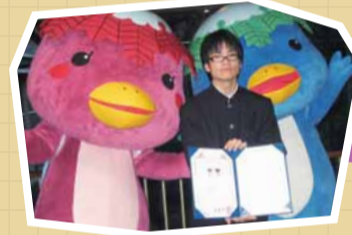
生徒考案のマスクットキャラクター「心美ちゃん」と「体健くん」が完成。 河内高等学校