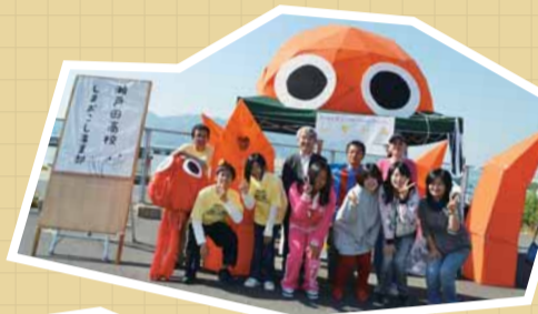
特産のタコとミカンをイメージしたテントを作り、島の魅力をPR。 瀬戸田高等学校