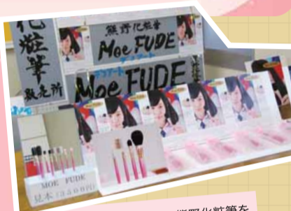
若い女性をターゲットに、熊野化粧筆をデコアートした「萌筆」を制作・販売。 熊野高等学校