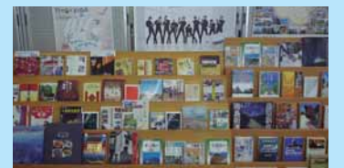
見るだけで旅行気分になれるような展示

広島空港の定期路線は、国内線5路線、国際線6路線が運行しています。広島空港からの空の旅をより一層楽しめるよう、国内線・国際線の就航地に関する資料や、飛行機に関する資料等を展示・貸出し、パンフレットを配布します。