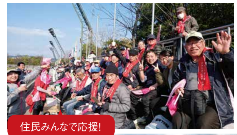
住民みんなで応援!

スポーツを中心とした地域活性化に取り組むため、広島県では新たに「スポーツアクティベーションひろしま(SAH)」を設置。このチームでは、県民の皆さんがスポーツを通して、地域が元気に、生き生きと笑顔になれるよう活動を進めています。今回は北広島町豊平地域をご紹介。アジアナンバーワンの実力を持つソフトテニスクラブ「どんぐり北広島」をきっかけに、住民同士が自然につながり、たくさんの笑顔が生まれています。