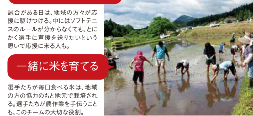
一緒に米を育てる

試合がある日は、地域の方が応援に駆けつける。中にはソフトテニスのルールが分からなくても、とにかく選手に声援を送りたいという思いで応援に来る人も。