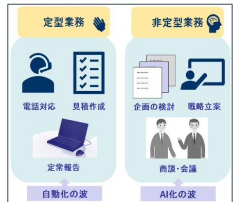
図 1：定型業務・非定型業務

【ポイント】 「定型業務のローコスト化」によって生じた時間や資金といった余剰リソースを、「非定型業務の差別化」に投資することが、企業競争力を高めることにつながります。