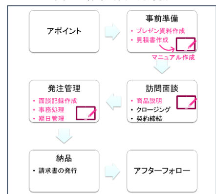
図 3：作業プロセス図と作業マニュアルの作成

各作業が正しく行われているかの判断基準（チェックポイント）を明確にしておきます。問題を早期発見し、誰でもミスなく作業が行えるようにします。