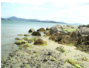
藻場・干潟（竹原市）

現在の水質環境は，これまでの規制的措置により，危機的な状況は脱したものの，近年の改善は横ばいの状況にあります。