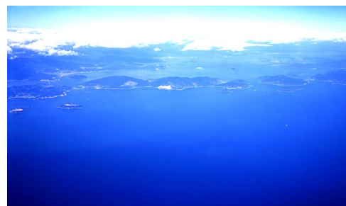
瀬戸内海（安芸灘諸島）

しかしながら，高度経済成長期には，工場排水や生活排水などが瀬戸内海に流入して水質環境が悪化したり，沿岸部が工業用地や住宅用地とするため次々と埋め立てられたりといったこともあり，瀬戸内海は親しみやすさゆえに，人間生活の影響を受けやすいという面も持っています。