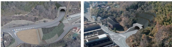
鞆松永線トンネル整備イメージ (福山市鞆)