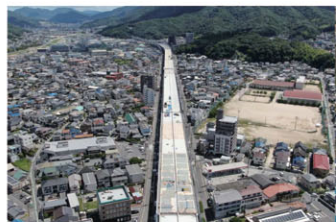
国道2号東広島・安芸BP (R4年7月時点)