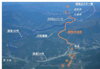
国道183号鍵掛峠道路