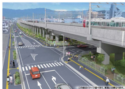
広島市東部地区連続立体交差事業整備イメージ (広島市安芸区)