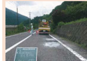
日々の道路パトロール (発見した穴の舗装補修状況)