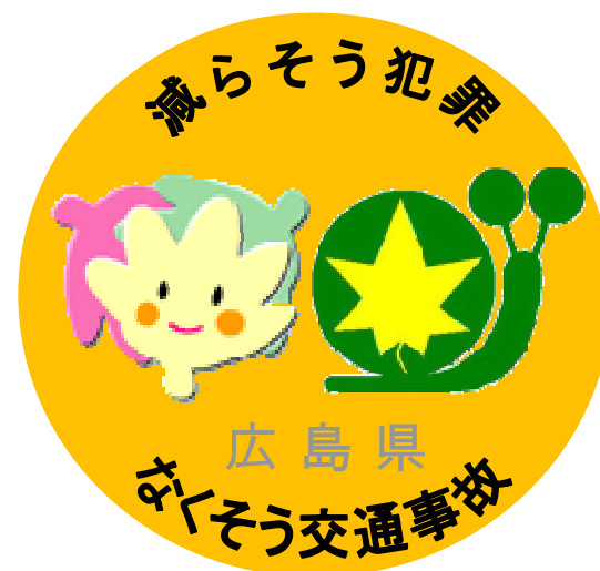
「減らそう犯罪・なくそう交通事故」 パートナーシップ シンボルマーク